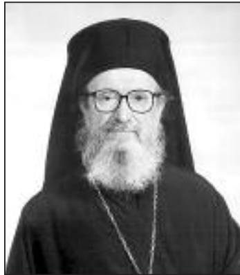
His Eminence Archbishop Demetrios Primate of the Greek Orthodox Church in America 10 East 79th St New York, NY 10021 (212)570-3500