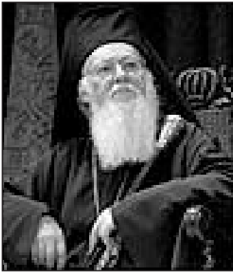
His All Holiness Bartholomew, Archbishop of Constantinople, New Rome and Ecumenical Patriarch Patrikhanesi 342 20 Fener-Halic Istanbul, Turkey Tel. +011-90-212.531.9670, 531-9676